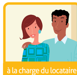
à la charge du locataire

Ce document a été conçu et réalisé par un groupe d'organismes de logement social de Rhône-Alpes pour vous aider à distinguer d'un seul coup d'œil les équipements qu'il vous appartient d'entretenir et ceux qui sont à la charge du propriétaire. Vous avez tout à gagner à entretenir régulièrement votre logement : vous réalisez ainsi des économies, renforcez votre sécurité et améliorez votre confort.