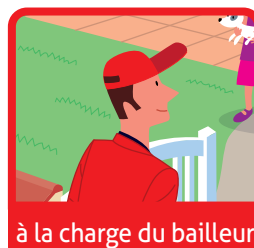
à la charge du bailleur

Les 2 codes couleurs qui figurent dans les illustrations indiquent à qui incombent les réparations et ce, conformément à la loi 89-462 du 6 juillet 1989 – paragraphes c) et d) de l'article 7 et au décret 87-712 du 26 août 1987.