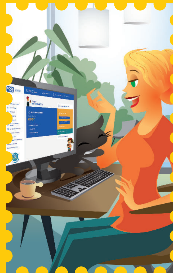
RCS 381 452 864 - DÉCEMBRE 2020